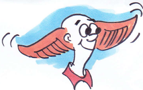
"SYN SOM EN ØRN"

Torsk er sundt, her er ingen grenser for en massevis av potenser: Du blir yngre,- du blir sexy, du blir sterk som en bjørn, du får utstråling, sjarme du strør om deg med varme, si – hva mere kan du ønske – du får syn som en ørn!