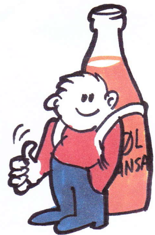
"HANSA I RYGGEN"

En gang hadde vi "Einars Verna", men i år fikk vi dronning Erna. Se hun kneiser som en keiser med sitt bergenske norsk. Hun er kjent nedpå Bryggen, hele "Hansa'n i ryggen, gamle klaner, stolte aner, hun er vokst opp med torsk!!